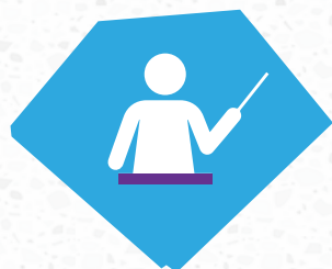
Les enseignants et les éducateurs non formels