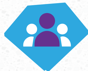
Les étudiants et les jeunes