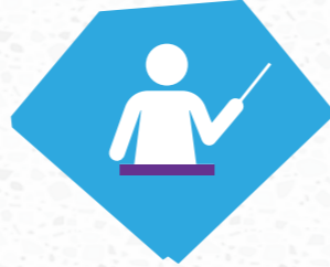
Lehrer und nicht-formale Pädagogen